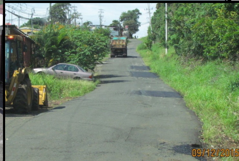
Trabajos de bacheo en Carrillos Bajo (Urb. La Senda y Calle La Cruz)