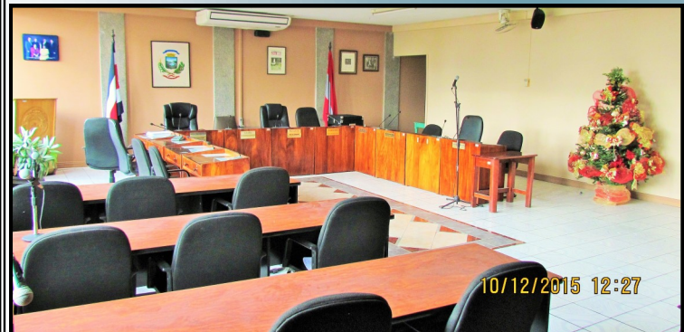
Mejoras en la Infraestructura del Edificio Municipal, Salón de Sesiones