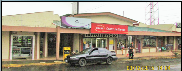
Mejoras en el Mercado Municipal (pintura, piso, techo, etc.)