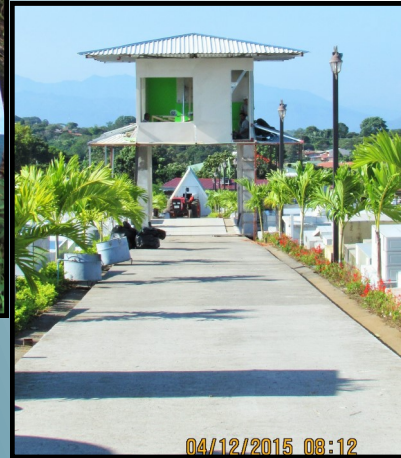
Mejoras en el Cementerio San Pedro, oficina y vigilancia