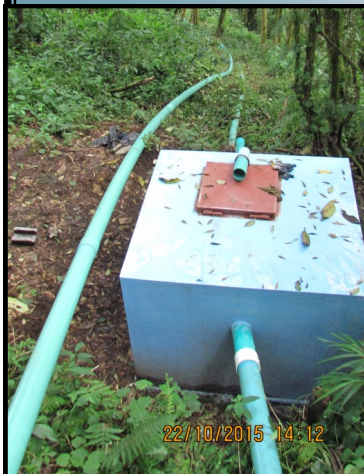
Nueva tubería captación de Poasito a la Pradera