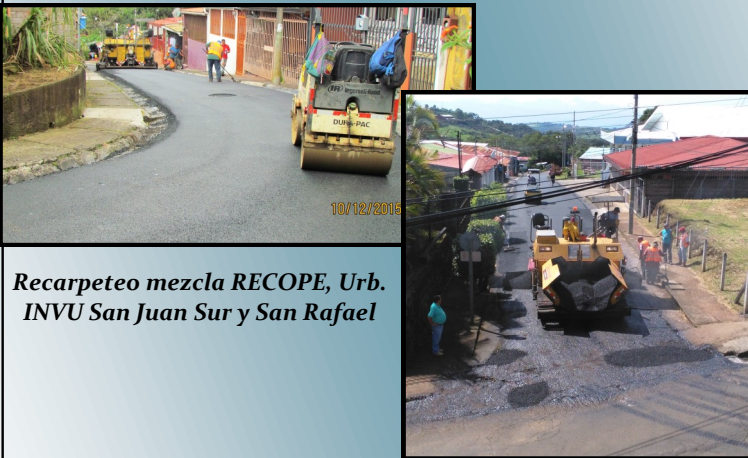
Recarpeteo mezcla RECOPE, Urb. INVU San Juan Sur y San Rafael

Convenio con RECOPE: Por 8 años consecutivos se logró formalizar la donación del 2015 y generó 1150 TM de mezcla asfáltica, para recarpetear las calles de algunas Urbanizaciones (INVU San Juan, BONIMUR-Coopecorales, San Pancraccio, Calle Rojas Carrillos, Calle Barahona-Represa Cacao, Calle El Molino, Calle Gabelo EBAIS San Rafael), etc. para un total aproximadamente de 1800 metros lineales de carpeta.